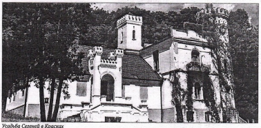
Усадьба Сеченей у Краскі